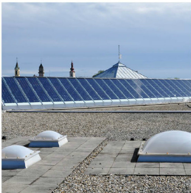
Blick von oben: Die Leibnitzer Schulen nutzen die starke Kraft der Sonne.