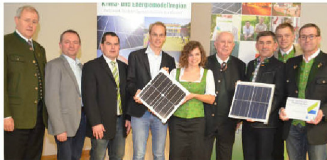
Eigenverbrauchsoptimierung und aktuelle Entwicklungen in der Fotovoltaik thematisierte man in der LFS Hatzendorf.

■ Die auf den landwirtschaftlichen Betrieben vorhandenen Dachflächen sowie der hohe Strombedarf in der sonnenstromintensivsten Zeit, schaffen die idealen Ausgangsbedingungen für die Errichtung einer Fotovoltaikanlage. Damit sich die Anlage schnell amortisiert, muss der überwiegende Anteil vom produzierten Sonnenstrom selbst verbraucht werden. Wichtige Tipps dazu präsentierte man beim Vortrag „Fotovoltaik in der Landwirtschaft“ in der landwirtschaftlichen Fachschule Hatzendorf. Thomas Loibnegger von der Landwirtschaftskammer Steiermark gab einen Einblick in optimierte Anlagenplanung