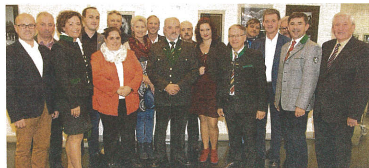
Prämierte Fotografen und Gäste der Landesfotoschau in Feldbach SCHLEICH

Die Ausstellung ist bis 29. November von Dienstag bis Sonntag (11 bis 17 Uhr) zu besichtigen.