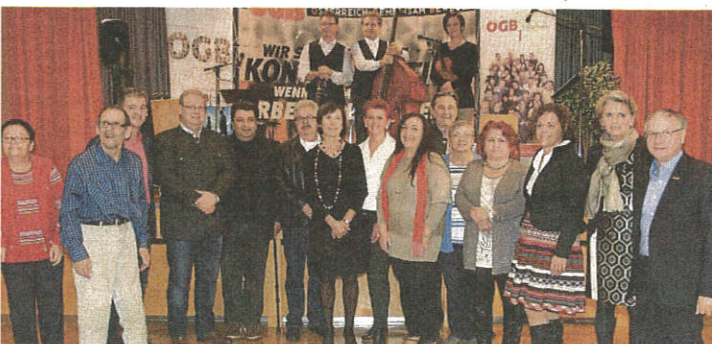
Zwölf Künstler stellten ihre Arbeiten im Feldbacher Volkshaus aus