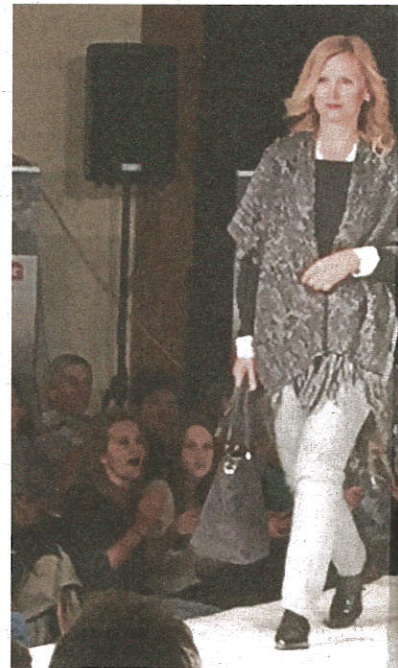
Kunden von Ferder machten als Models