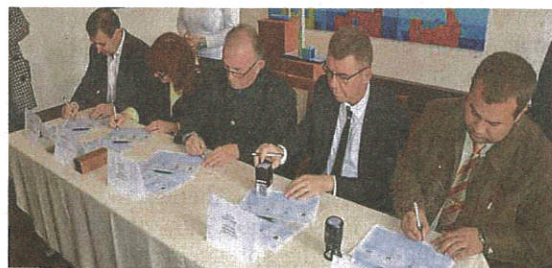
In der Burg in Lendava wurde die Partnerschaftserklärung erneuert

Ein gutes Verständnis für Wertschöpfung und Wirtschaftsprozesse von Schülern und Jugendlichen war den Veranstal-