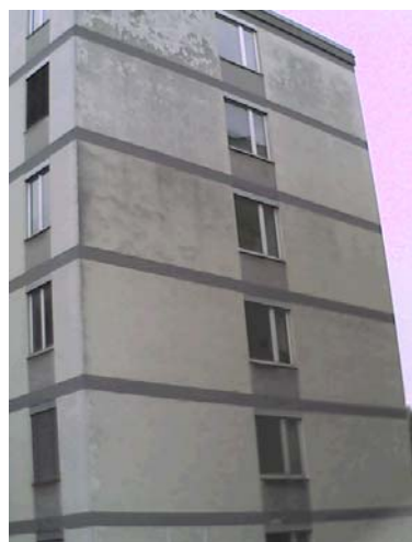
Abbildung: Schwachstellen in der Gebäudehülle werden erst durch eine Thermographieaufnahme ersichtlic